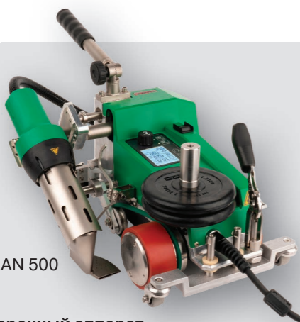
LEISTER UNIPLAN 500